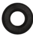
3.201.00 Kleberosette in Schwarzstahl-Optik*