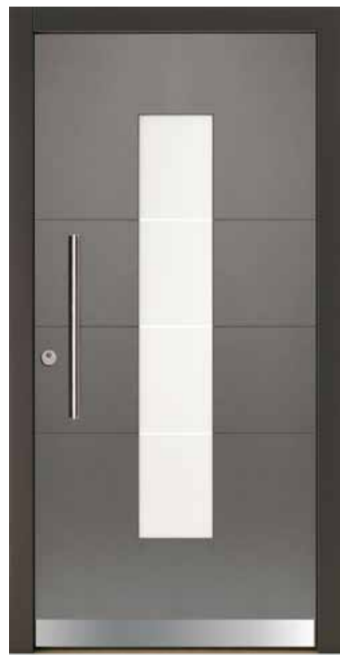
KlimaFitBasic 1004 Trend 903 Stock Trend 905 Glasdesign 1003G, Fläche matt, Streifen klar Stoßgriff 1100E 600 mm Rosette 4100E Wetterschenkel 90 mm Edelstahl