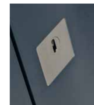
4200E.b Edelstahl (flächenbündig)