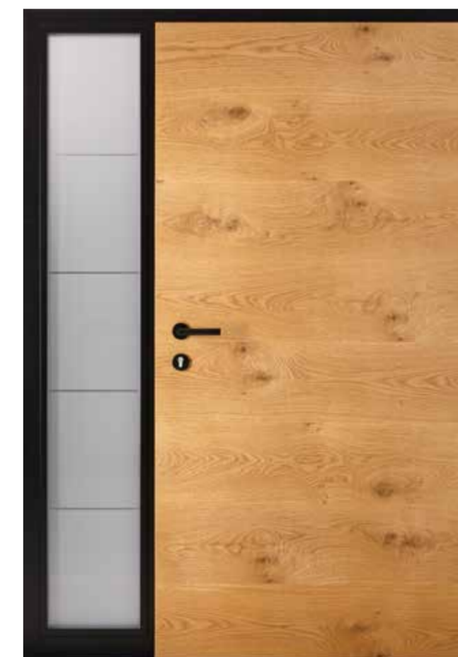
innen Eiche astig markant lasiert 635E Stock RAL 9005 Tiefschwarz Innengarnitur 6100S Bänder 2D Schwarz