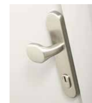
5000E Edelstahl außen