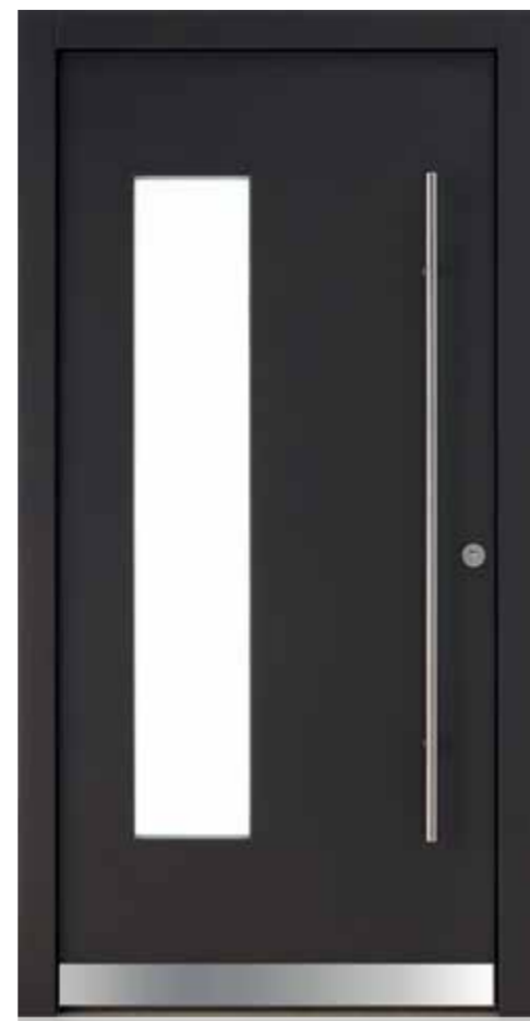
KlimaFitBasic 1003 Trend 933 Glas Satinato Weiß Stoßgriff 1100E 1400 mm Rosette 4100E Wetterschenkel 90 mm Edelstahl