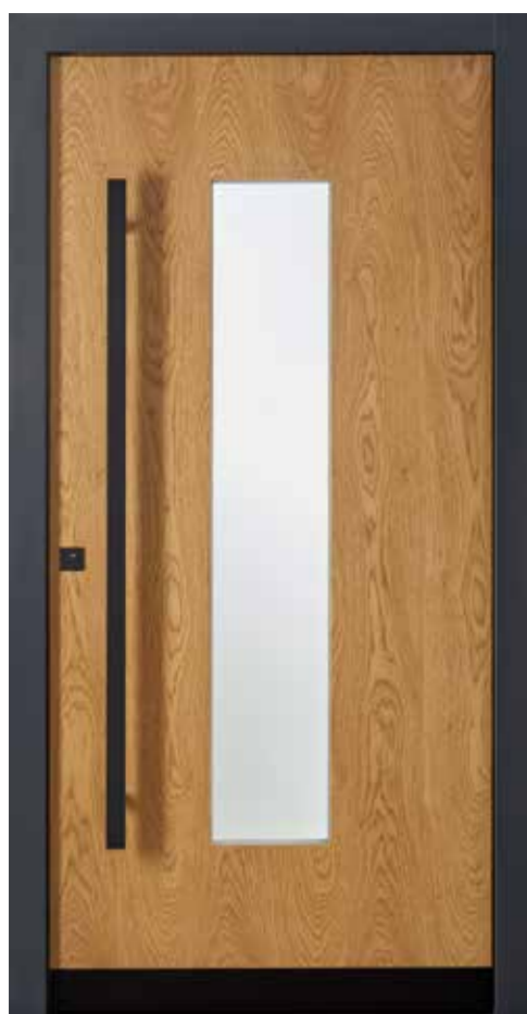
KlimaFitBasic-Holz 1001 Eiche astig lasiert 635E Stock RAL 7016 Anthrazitgrau Glas Reflo Stoßgriff 1440S 1400 mm Rosette 4200S Wetterschenkel 90 mm Edelstahl, RAL 9005 Tiefschwarz lackiert