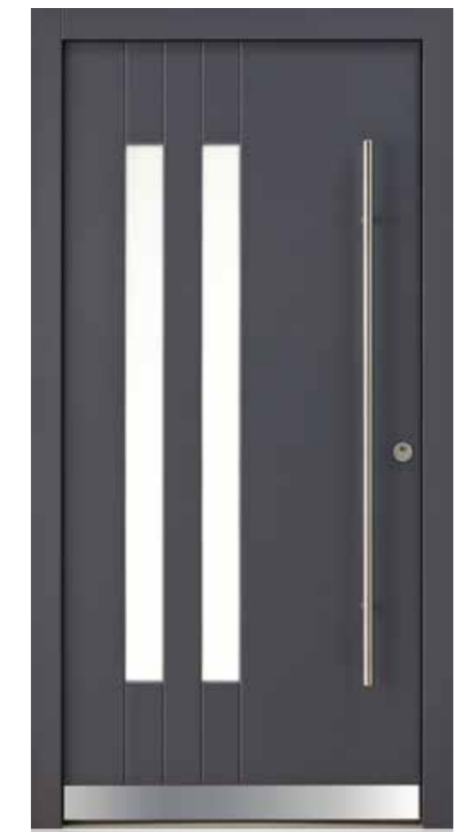
KlimaFitBasic 1007 RAL 7015 Schiefergrau Glas Satinato Weiß Stoßgriff 1100E 1400 mm Rosette 4100E Wetterschenkel 90 mm Edelstahl