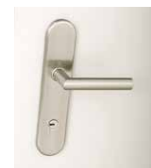
5000E Edelstahl innen (nur mit Schutzgarnitur 5000E außen kombinierbar)