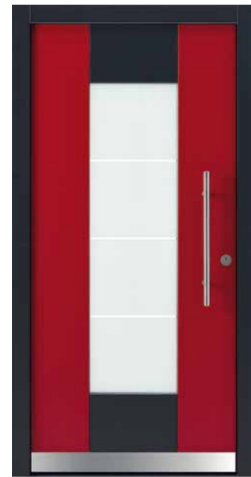
KlimaFitBasic 1011 RAL 3003 Rubinrot Stock/Friese oben und unten RAL 7021 Schwarzgrau Glasdesign 1003G, Fläche matt, Streifen klar Stoßgriff 1100E 600 mm Rosette 4100E.b Wetterschenkel 90 mm Edelstahl