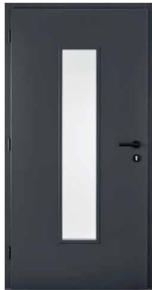
innen RAL 7016 Anthrazitgrau Innengarnitur 6100S Bänder 2D Schwarz