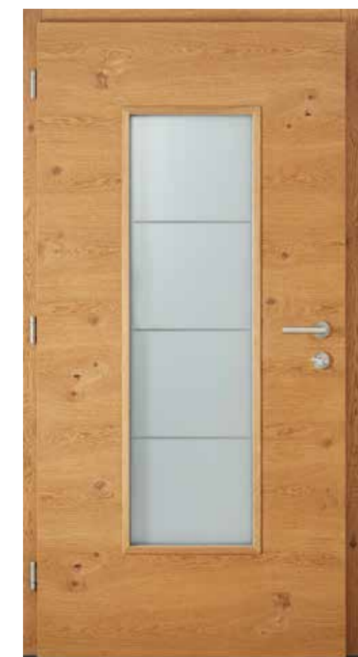
innen Eiche astig lasiert 635E Innengarnitur 6100E Bänder 2D F2-farbig