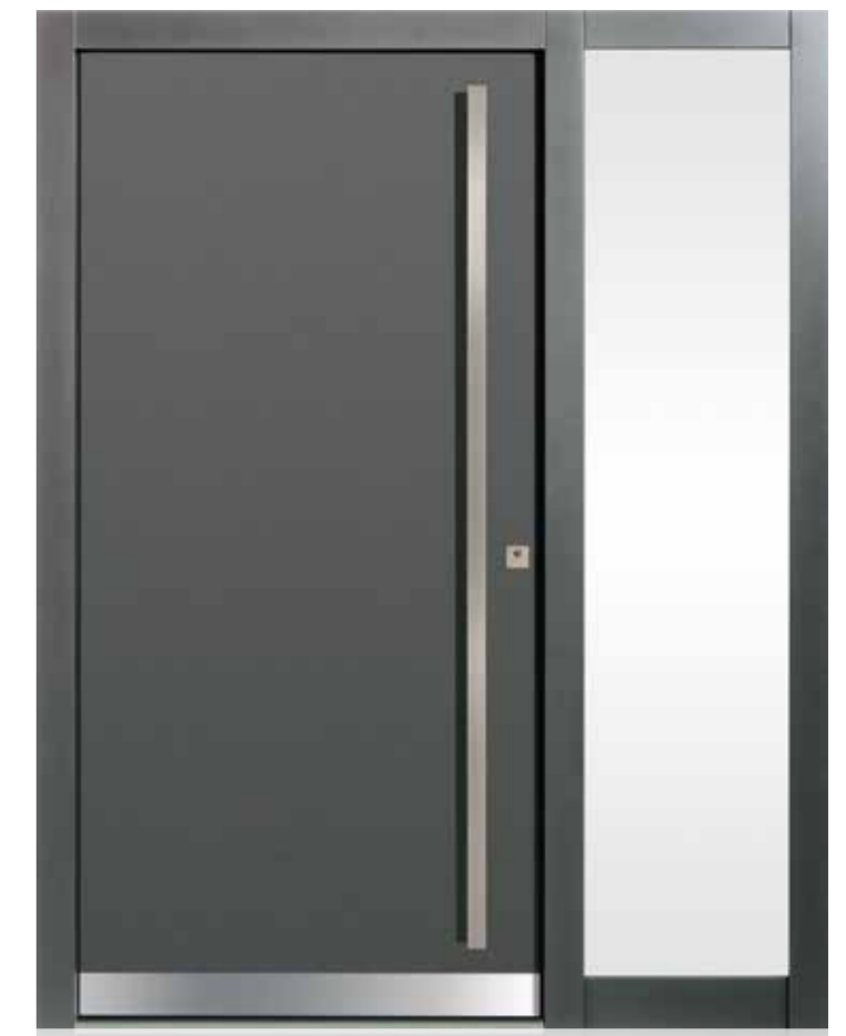
KlimaFitBasic 1005 Trend 931 Seitenteil S1_650 Glas Satinato Weiß Stoßgriff 1100E 1800 mm Rosette 4200E Wetterschenkel 90 mm Edelstahl