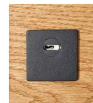
4200S Schwarz beschichtet