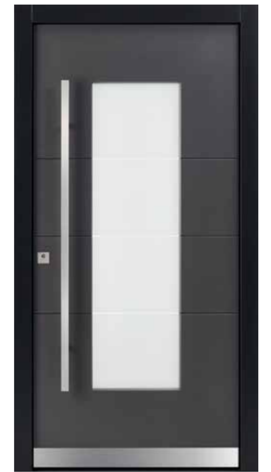
KlimaFitBasic 1010 Trend 903 Stock Trend 905 Glasdesign 1003G, Fläche matt, Streifen klar Stoßgriff 1440E 1400 mm Rosette 4200E Wetterschenkel 90 mm Edelstahl