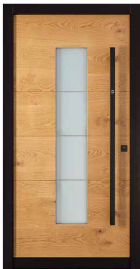
KlimaFitBasic-Holz 1004 Eiche astig markant lasiert 635E Stock RAL 9005 Tiefschwarz Glasdesign 1004G, Fläche matt, Streifen klar Stoßgriff 1440S.F 1400 mm mit Fingerscan Rosette 4200S Wetterschenkel 90 mm Edelstahl, RAL 9005 Tiefschwarz lackiert