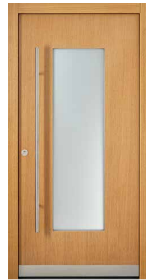
KlimaFitBasic-Holz 1009 Eiche lasiert 635E Glas Satinato Weiß Stoßgriff 1100E 1400 mm Rosette 4100E Wetterschenkel 90 mm Edelstahl