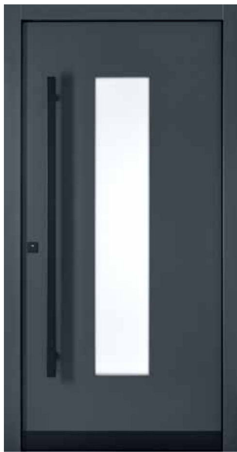
KlimaFitBasic 1001 RAL 7016 Anthrazitgrau Glas Satinato Weiß Stoßgriff 1440S 1400 mm Rosette 4200S Wetterschenkel 90 mm Edelstahl, RAL 9005 Tiefschwarz lackiert