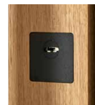
4200S.b Schwarz beschichtet (flächenbündig)