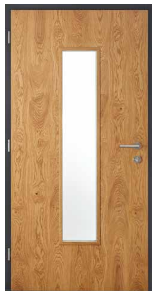
innen Eiche astig lasiert 635E Stock RAL 7016 Anthrazitgrau Innengarnitur 6100E Bänder 2D FZ-farbig