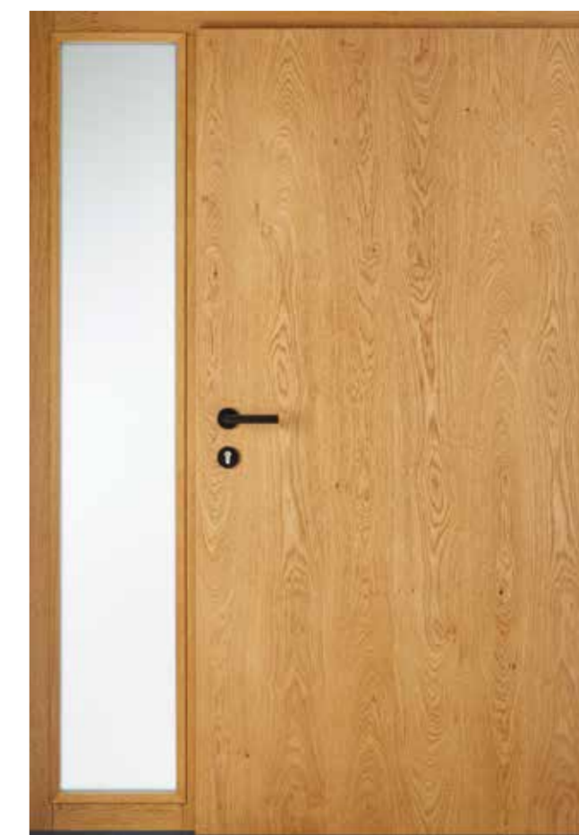
innen Eiche astig lasiert 635E Innengarnitur 6100S Bänder 2D Schwarz