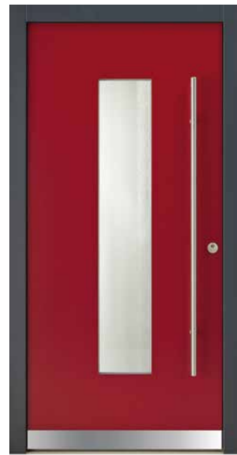
KlimaFitBasic 1001 RAL 3004 Purpurrot Stock RAL 7016 Anthrazitgrau Glas Chinchilla Weiß Stoßgriff 1100E 1400 mm Rosette 4100E Wetterschenkel 90 mm Edelstahl