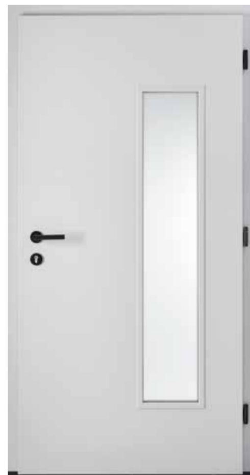
innen RAL 9016 Verkehrsweiß Innengarnitur 6100S Bänder 2D Schwarz