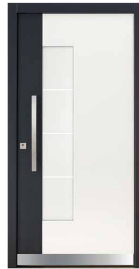
KlimaFitBasic 1002 RAL 9016 Verkehrsweiß Stock/Schlossfries RAL 7016 Anthrazitgrau Glasdesign 1003G, Fläche matt, Streifen klar Stoßgriff 1440E 600 mm Rosette 4200E Wetterschenkel 90 mm Edelstahl