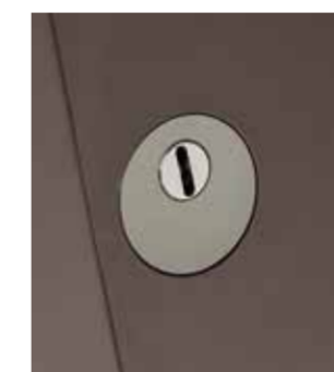
4100E.b Edelstahl (flächenbündig)