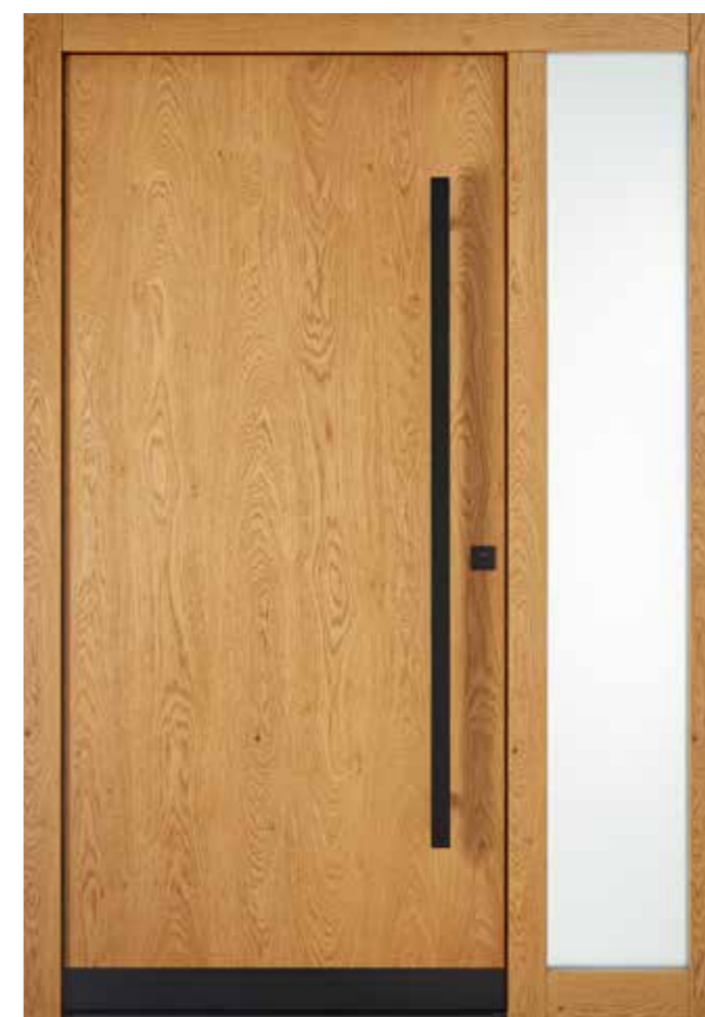
KlimaFitBasic-Holz 1005 Eiche astig lasiert 635E Seitenteil S1_400 Glas Satinato Weiß Stoßgriff 1440S 1400 mm Rosette 4200S Wetterschenkel 90 mm Edelstahl, RAL 9005 Tiefschwarz lackiert