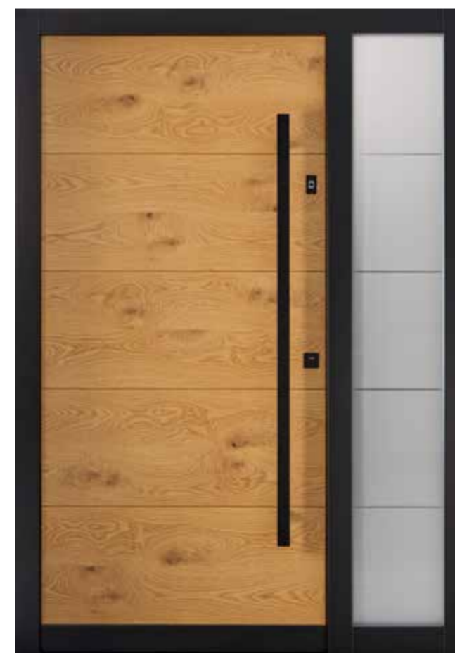
KlimaFitBasic-Holz 1012 Eiche astig markant lasiert 635E Stock RAL 9005 Tiefschwarz Seitenteil S1_400 Glasdesign 2004G, Fläche matt, Streifen klar Stoßgriff 1440S 1400 mm Rosette 4200S Fingerscan mit Abdeckung RAL 9005 Tiefschwarz Wetterschenkel 90 mm Edelstahl, RAL 9005 Tiefschwarz lackiert