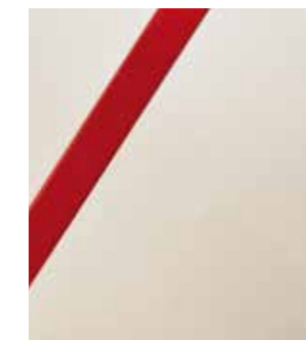
Float (VSG) Weiß