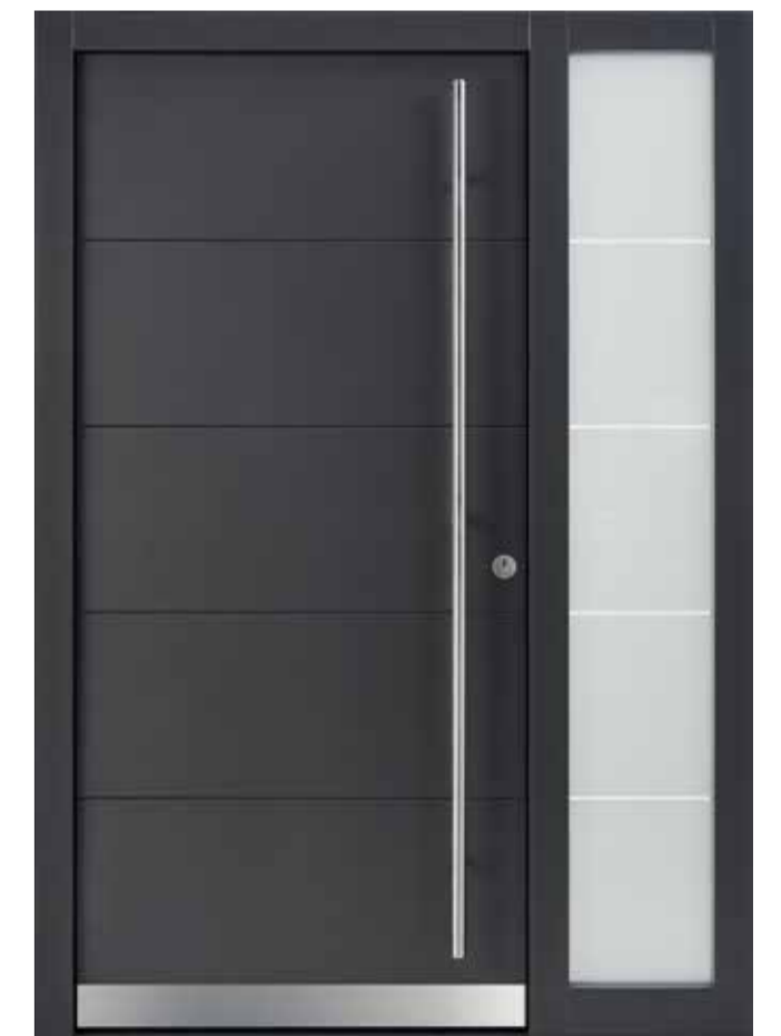
KlimaFitBasic 1012 Trend 933 Seitenteil S1_400 Glasdesign 2004G, Fläche matt, Streifen klar Stoßgriff 1100E 1800 mm Rosette 4100E Wetterschenkel 90 mm Edelstahl