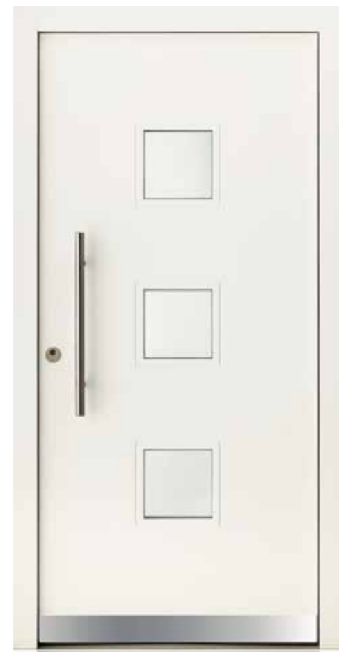
KlimaFitBasic 1008 RAL 9016 Verkehrsweiß Glas Mastercarre Weiß Stoßgriff 1100E 600 mm Rosette 4100E Wetterschenkel 90 mm Edelstahl