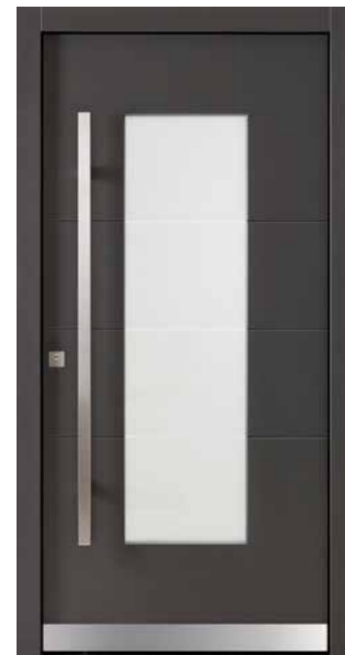
KlimaFitBasic 1010 Trend 933 Glasdesign 1003G, Fläche matt, Streifen klar Stoßgriff 1440E 1400 mm Rosette 4200E.b Wetterschenkel 90 mm Edelstahl