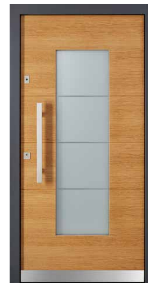
KlimaFitBasic-Holz 1010 Eiche lasiert 635E Stock RAL 7015 Schiefergrau Glasdesign 1003G, Fläche matt, Streifen klar Stoßgriff 1440E 600 mm Rosette 4200E Wetterschenkel 90 mm Edelstahl