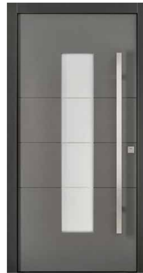
KlimaFitBasic 1004 Trend 903 Stock Trend 905 Glasdesign 1003G, Fläche matt, Streifen klar Stoßgriff 1440E 1400 mm Rosette 4200E