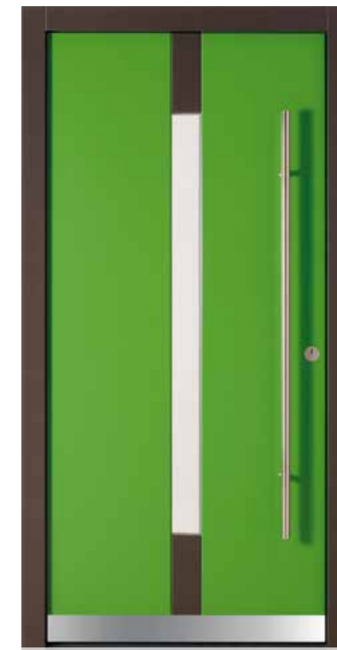
KlimaFitBasic 1006 RAL 6018 Gelbgrün Stock/Fries oben und unten Trend 931 Glas Float Weiß Stoßgriff 1100E 1400 mm Rosette 4100E Wetterschenkel 90 mm Edelstahl