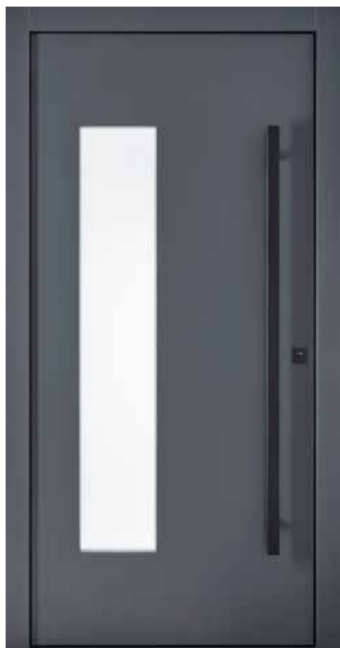
KlimaFitBasic 1003 RAL 7016 Anthrazitgrau Glas Satinato Weiß Stoßgriff 1440S 1400 mm Rosette 4200S