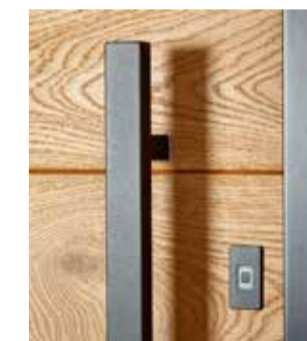
1440S Schwarz beschichtet