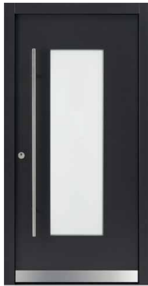
KlimaFitBasic 1009 Trend 904 Glas Satinato Weiß Stoßgriff 1100E 1400 mm Rosette 4100E.b Wetterschenkel 90 mm Edelstahl