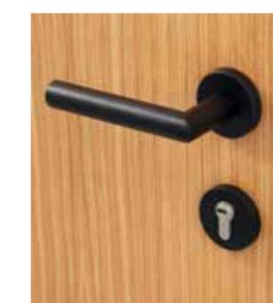
6100S Schwarz beschichtet