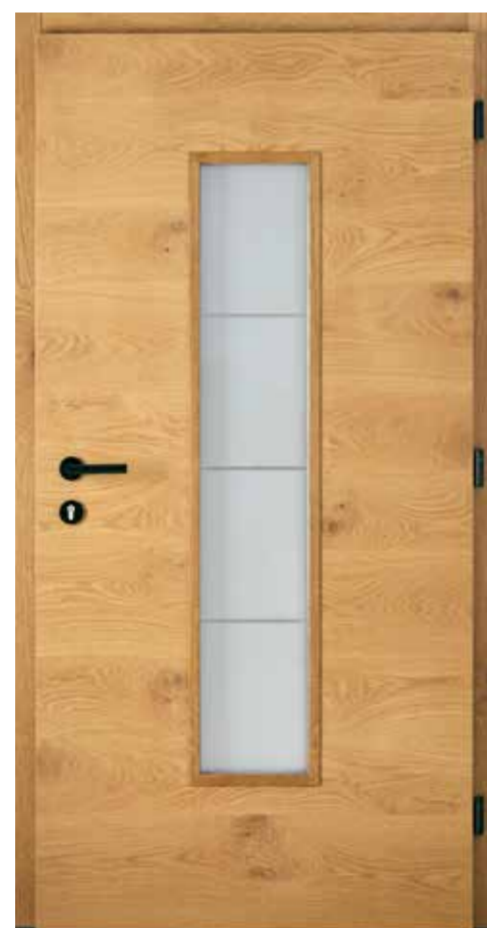
innen Eiche astig markant lasiert 635E Innengarnitur 6100S Bänder 2D Schwarz